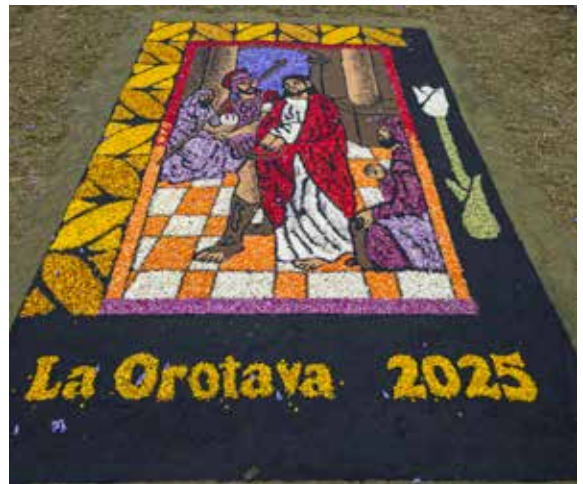
Javier Trujillo de la Nuez