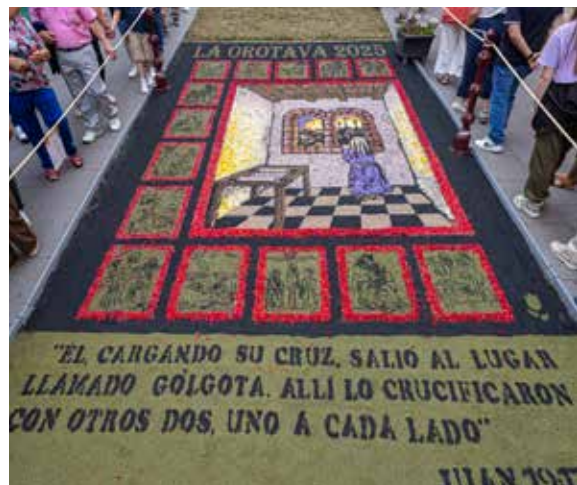
Unión Cultural "El Canario"