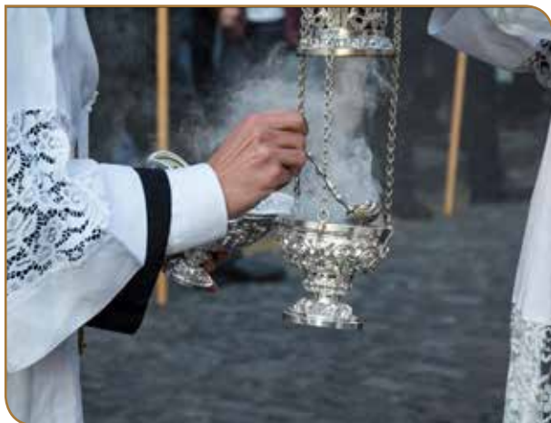
Detalle Incensario. Iglesia de San Francisco.