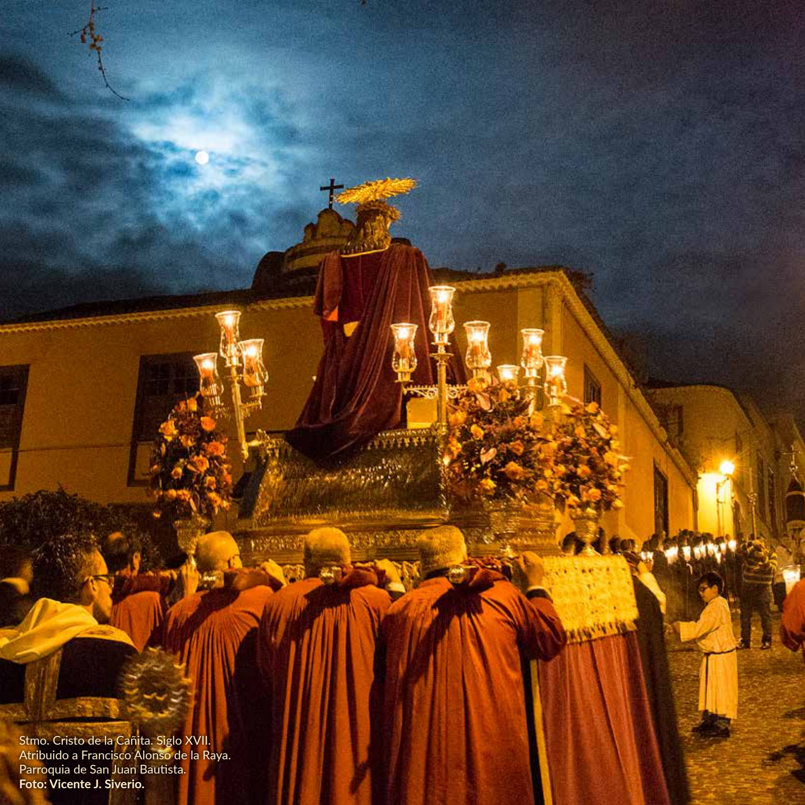
Stmo. Cristo de la Cañita. Siglo XVII. Atribuido a Francisco Alonso de la Raya. Parroquia de San Juan Bautista.