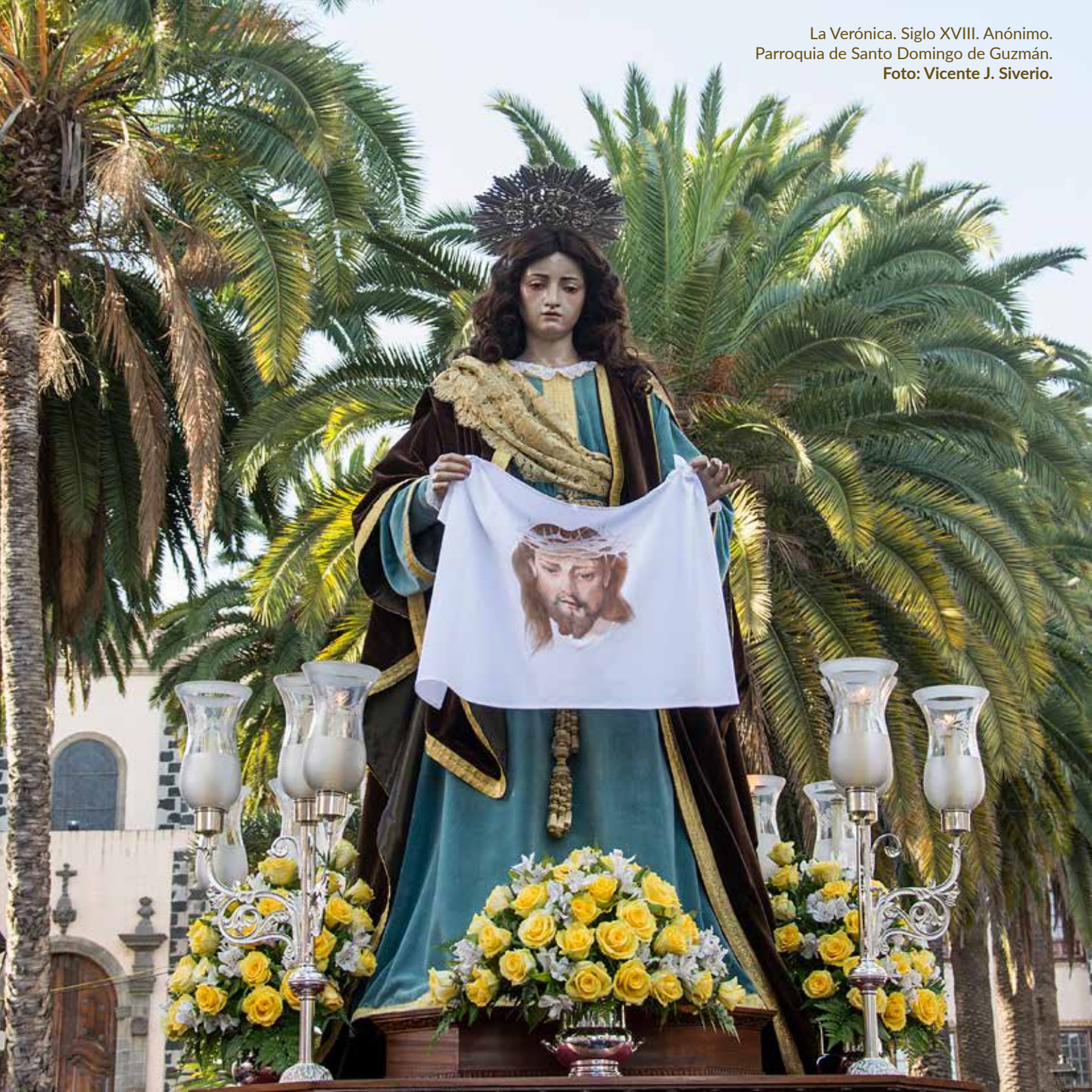
La Verónica. Siglo XVIII. Anónimo. Parroquia de Santo Domingo de Guzmán.