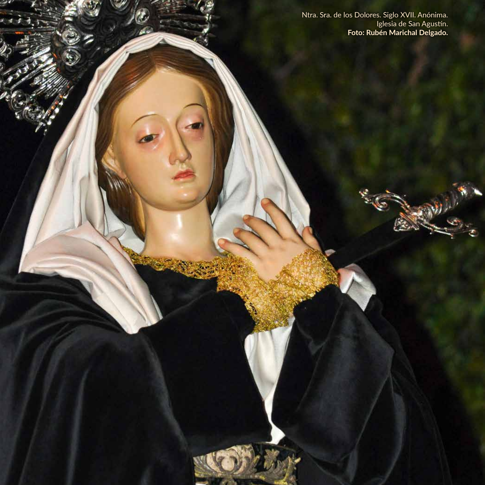
Ntra. Sra. de los Dolores. Siglo XVII. Anónima. Iglesia de San Agustín.