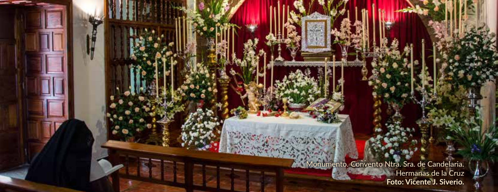
Monumento. Convento Ntra. Sra. de Candelaria. Hermanas de la Cruz