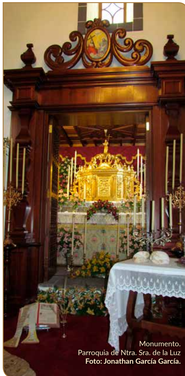
Monumento. Parroquia de Ntra. Sra. de la Luz