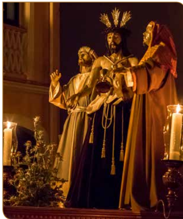
Stmo. Cristo del Despojo. Año 1999. Pablo Torres Luis Parroquia de Santo Domingo de Guzmán.