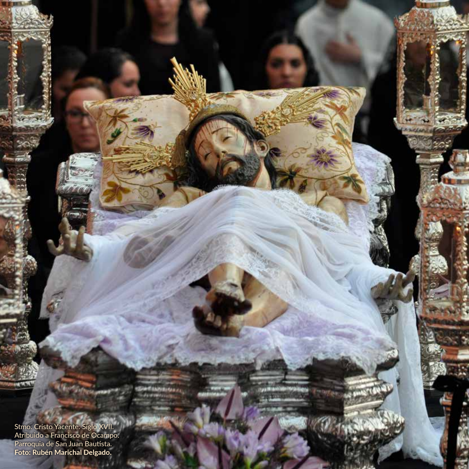
Stmo. Cristo Yacente. Siglo XVII. Atribuido a Francisco de Ocampo. Parroquia de San Juan Bautista.