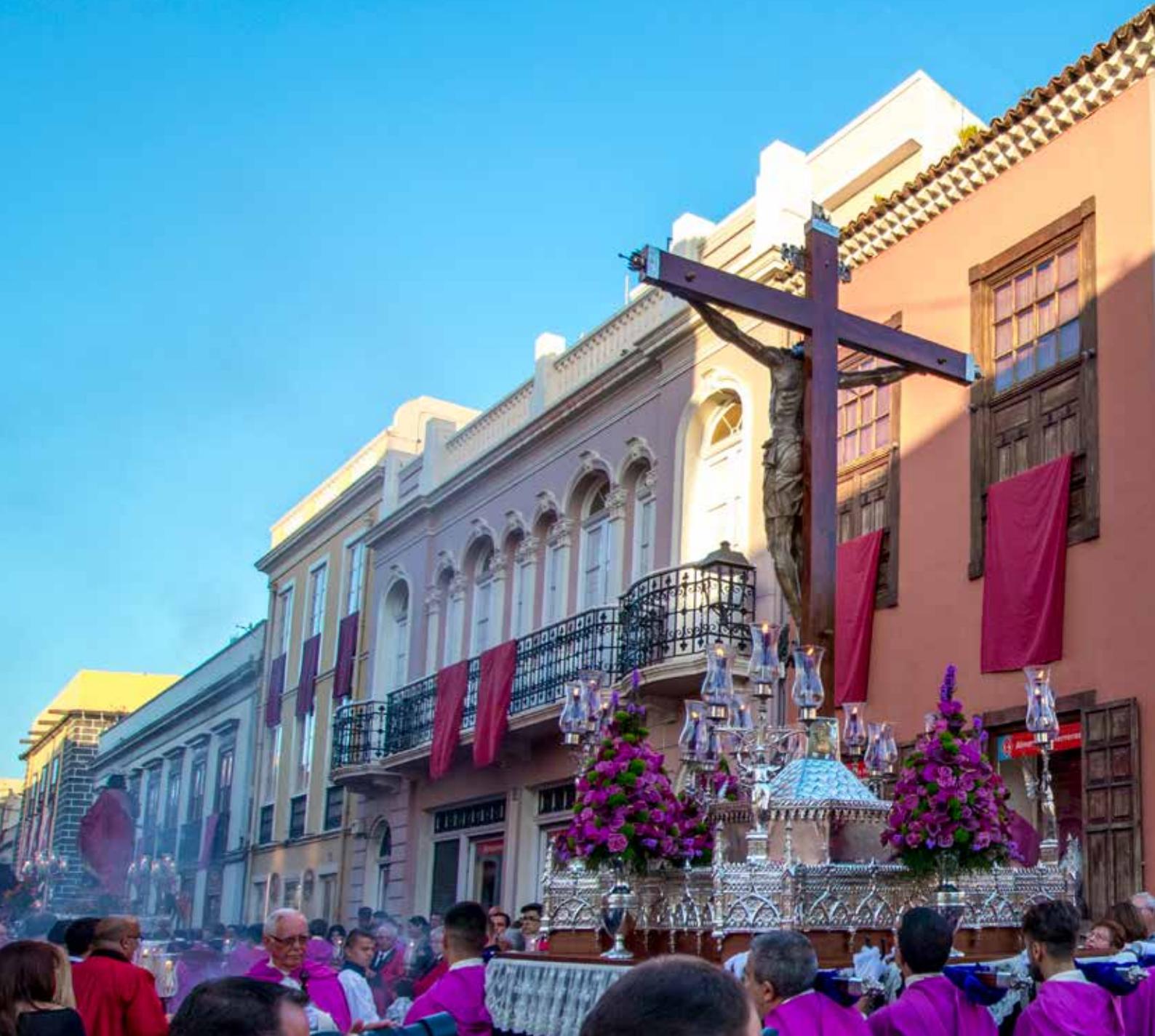
Procesión del Mandato. Parroquia de Ntra. Sra. de la Concepción.