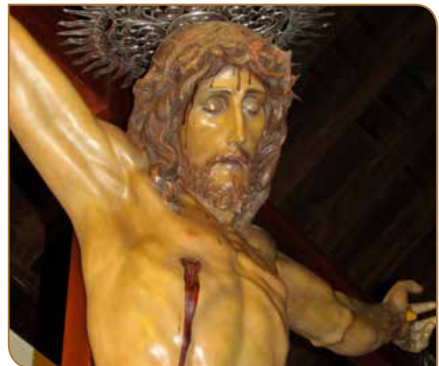
Cristo Crucificado. Parroquia Ntra. Sra. del Rosario, La Perdoma.