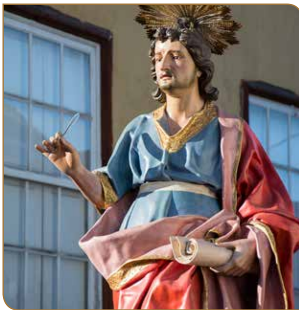
San Juan Evangelista. Año 1799. José Luján Pérez. Parroquia de Ntra. Sra. de la Concepción. Foto: Vicente J. Siverio.