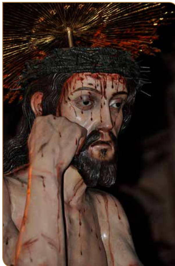
Stmo. Cristo de la Humildad y Paciencia. Siglo XVII. Anónimo. Iglesia de San Agustín.

“quiere que todos los hombres se salven y lleguen al conocimiento de la verdad” (1 Timoteo 2,4). Debemos acercarnos a Cristo “su unigénito Hijo, para que todo el que crea en él no perezca, sino que tenga la vida eterna” (Juan 3,16).