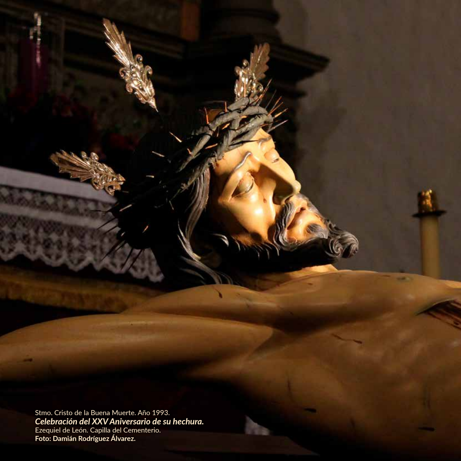
Stmo. Cristo de la Buena Muerte. Año 1993. Celebración del XXV Aniversario de su hechura. Ezequiel de León. Capilla del Cementerio.