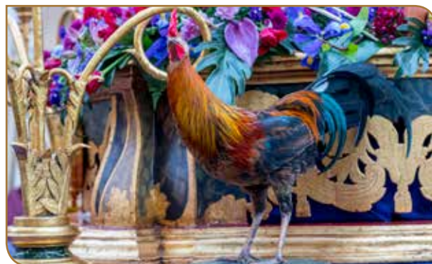
Detalle Gallo. Stmo. Cristo del Perdón. Iglesia de San Agustín.

Vivamos este regalo de nuestra salvación como nos dice San Pablo: “Por pura gracia estáis salvados. Porque estáis salvados por su gracia y mediante la fe. Y no se debe a vosotros, sino que es un don de Dios” (Efesios 2, 5-8).