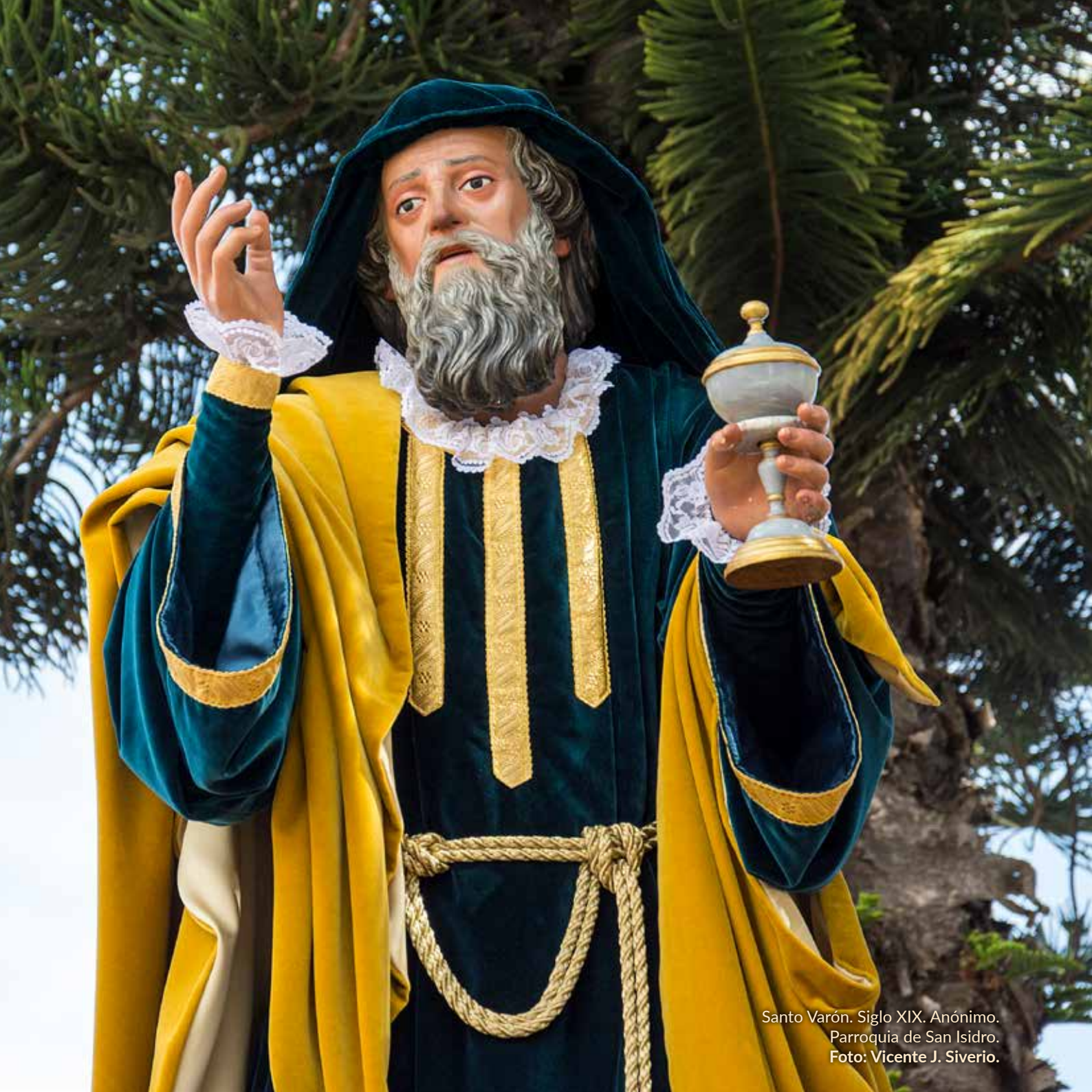
Santo Varón. Siglo XIX. Anónimo. Parroquia de San Isidro.