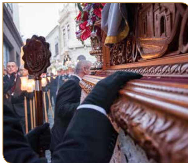
Detalle Trono. Iglesia de San Francisco.