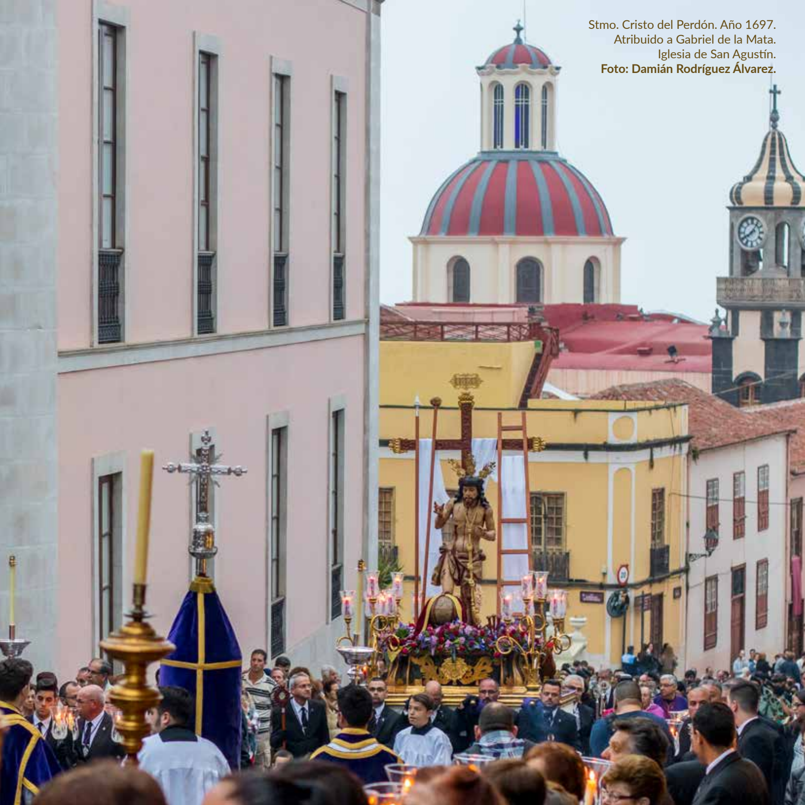
Stmo. Cristo del Perdón. Año 1697. Atribuido a Gabriel de la Mata. Iglesia de San Agustín.