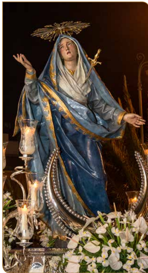
Virgen de Gloria. Siglo XVIII-XIX. José Luján Pérez. Parroquia de San Juan Bautista.