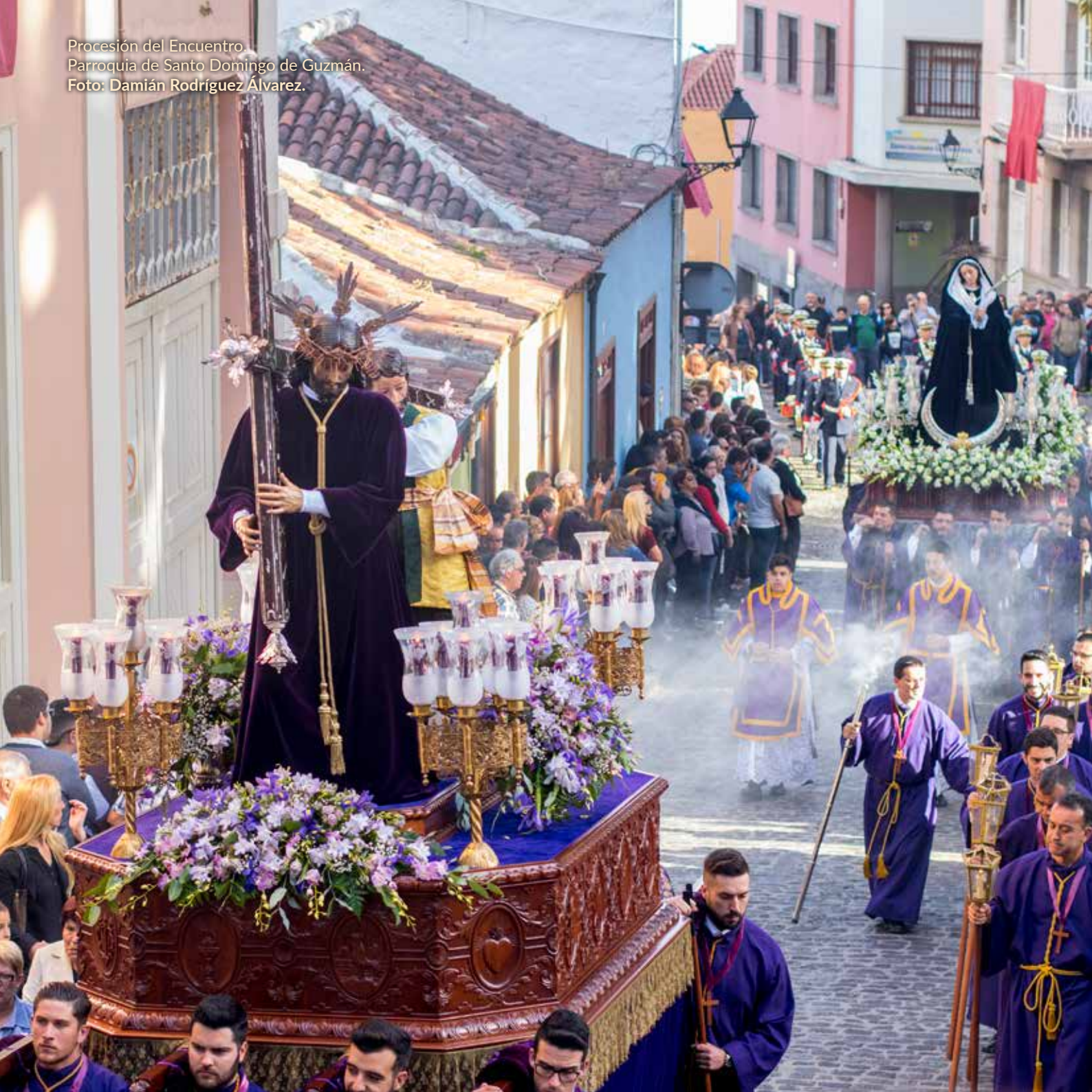
Procesión del Encuentro. Parroquia de Santo Domingo de Guzmán.