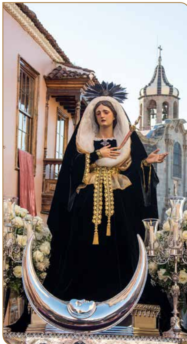
Virgen de los Dolores. Siglo XIX. José Luján Pérez. Parroquia Ntra. Sra. de la Concepción.