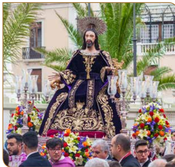
Stmo. Cristo Predicador. Año 1667. Blas García Ravelo. Parroquia de Ntra. Sra. de la Concepción.