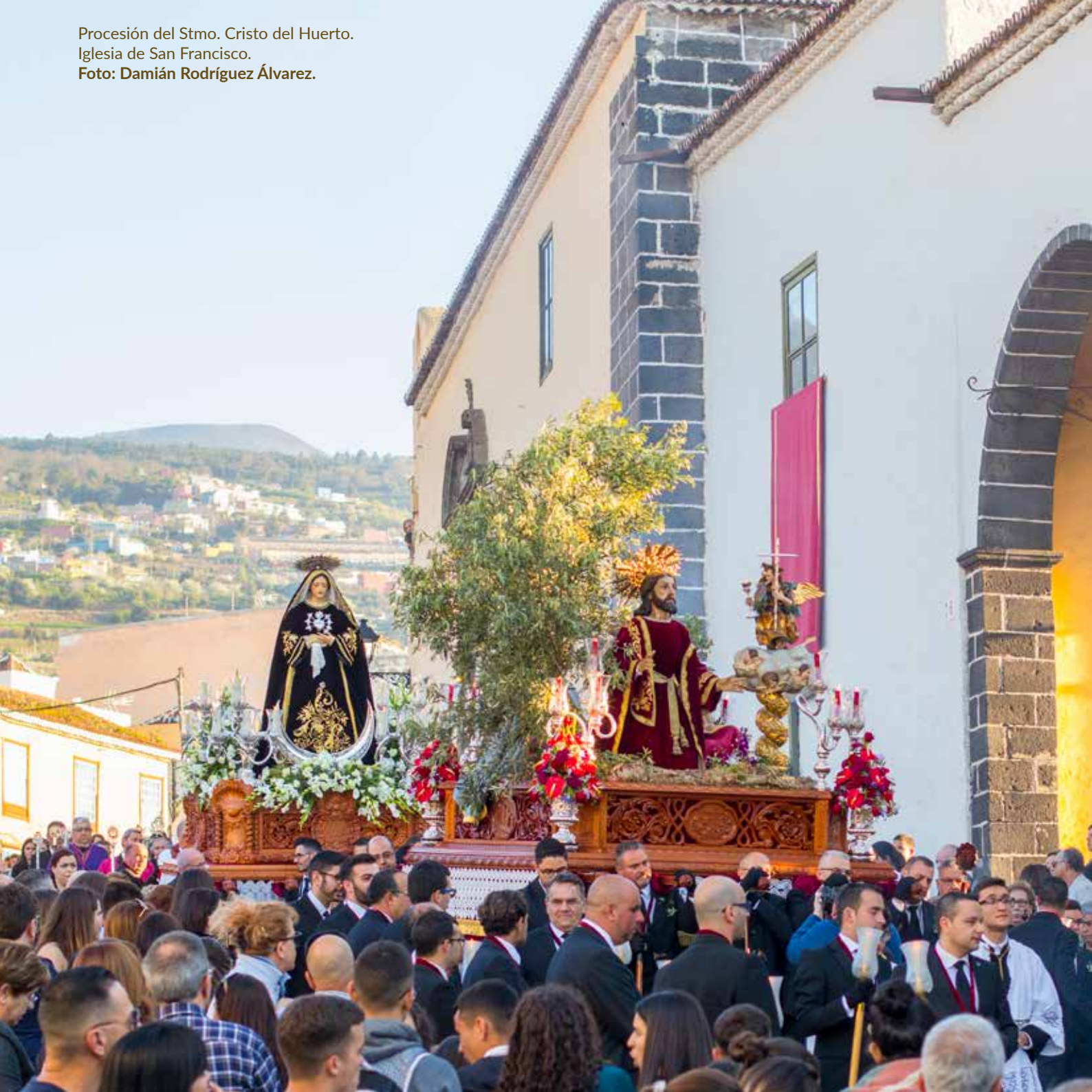
Procesión del Stmo. Cristo del Huerto. Iglesia de San Francisco.