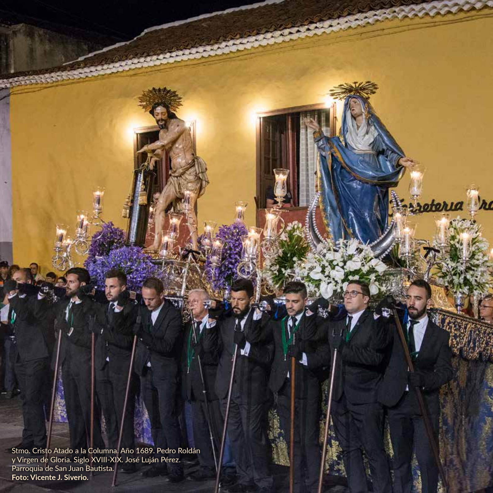
Stmo. Cristo Atado a la Columna. Año 1689. Pedro Roldán y Virgen de Gloria. Siglo XVIII-XIX. José Luján Pérez. Parroquia de San Juan Bautista.