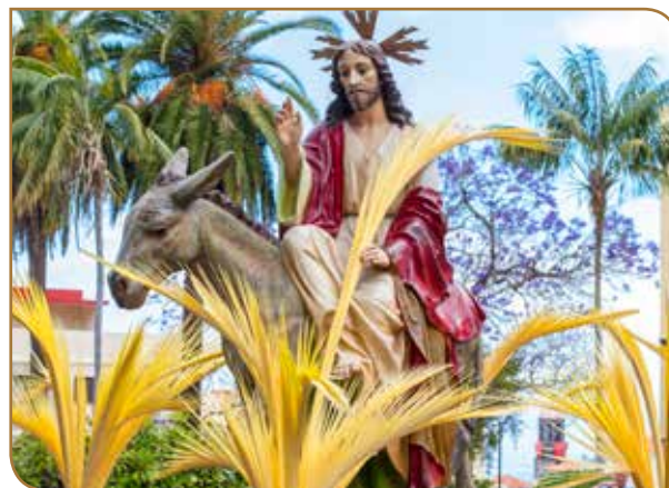
Entrada Triunfal de Jesús en Jerusalén. Año 1957. Olot. Iglesia de María Auxiliadora.