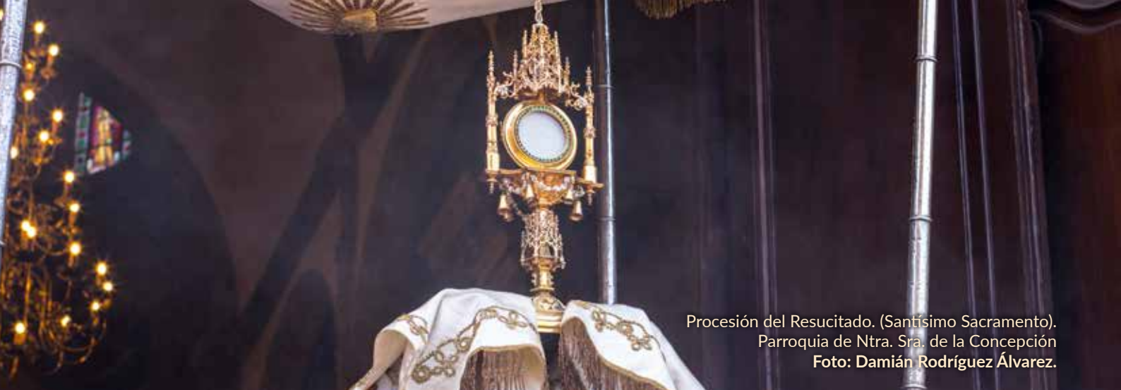
Procesión del Resucitado. (Santísimo Sacramento). Parroquia de Ntra. Sra. de la Concepción