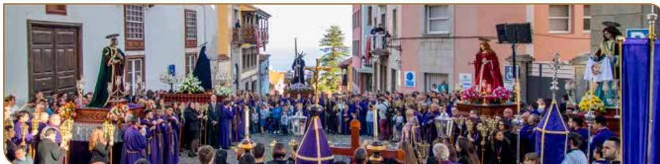
Procesión del Encuentro. Parroquia de Santo Domingo de Guzmán.