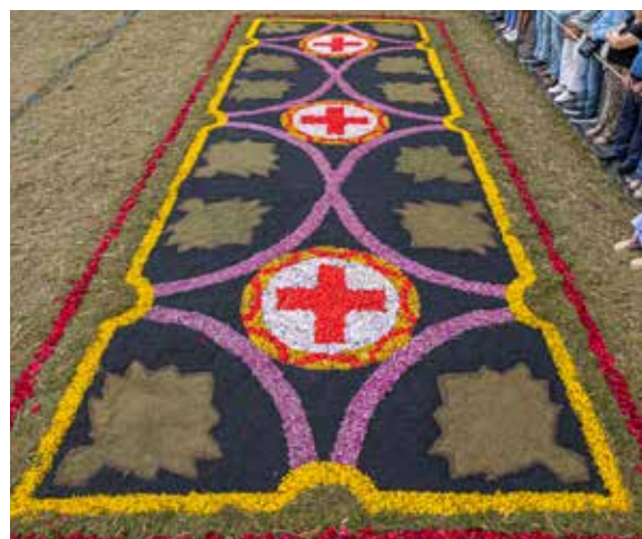
I.E.S. Villalba Hervás