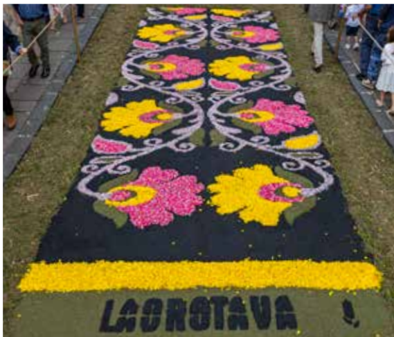
AA.VV. La Perdoma