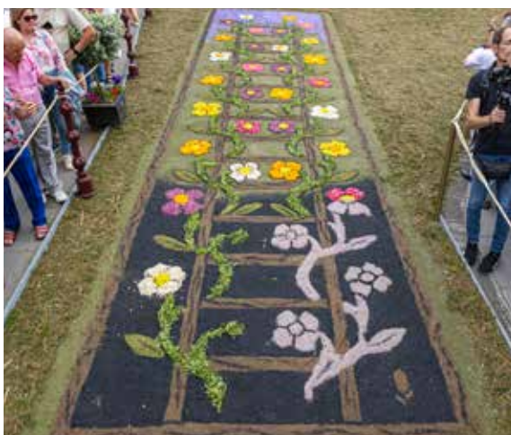
Riquelme Toste y colaboradores