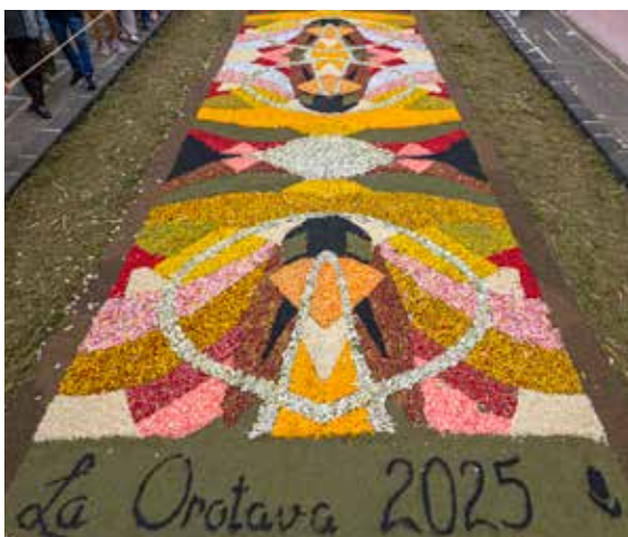
Colegio Salesianos - San Isidro