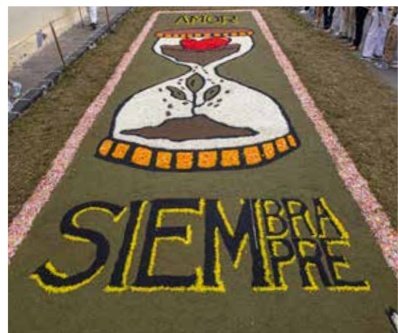
I.E.S. La Orotava