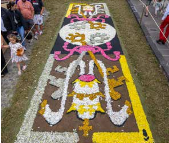
AA.VV. La Florida