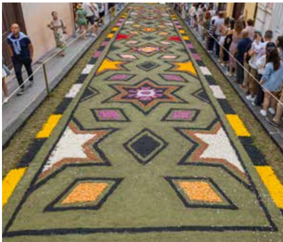
Eustaquio Bello y funcionarios