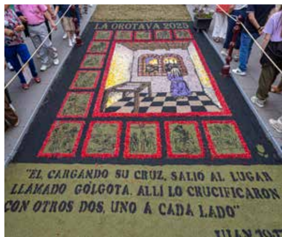
Unión Cultural "El Canario"