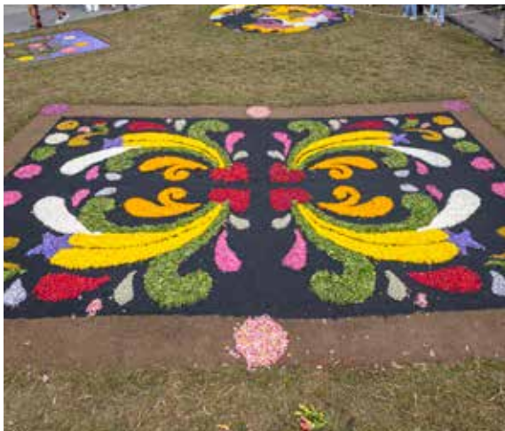
AA.VV. Los Pinos