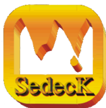
Sociedad Española de Espeleología y Ciencias del Karst