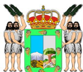
Excmo. AYUNTAMIENTO DE ICOD DE LOS VINOS CONCEJALIA DE DEPORTES CONCEJALIA DE TURISMO